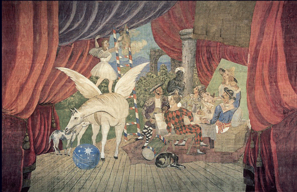
* peinture à la colle sur une toile mixte.

Cette oeuvre monumentale de 10,5/16,5 m et d'un poids d'environ 60kg sera présentée en 2012 au Centre Pompidou de Metz.